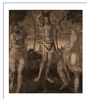
Mestre de S. Sebastião de Angra, 1580 Óleo sobre madeira de cedro MAHR96476

Este painel, conjuntamente com outros dois, Martírio pela Sagitação e Martírio pela Flagelação , fez parte do antigo retábulo da capela mor da Igreja Matriz de S. Sebastião na ilha Terceira, quando esta foi ampliada e reconstruída no ano de 1568.